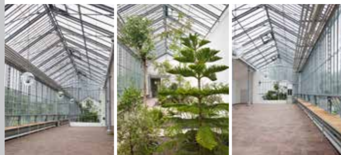
Innenraum des Eisernen Hauses mit Bepflanzung

VERE FRVOR SEMPER / FLORAE NITIDISSIMVS HORTVS. – »Stets genieße ich den Frühling, üppig blühender Garten der Flora«. So lautet die stimmungsvolle Inschrift über dem westlichen Eingang zum Eisernen Haus. Viel ist dem nicht mehr hinzuzufügen. Genussvolle und unvergessliche Momente garantiert das 1807 erbaute historische Gewächshaus im Schlosspark. In unmittelbarer Nähe zum Café Palmenhaus gelegen, ist das elegant mit exotischen Pflanzen bestückte Glashaushaus ideal für eine Feier im kleinen Kreis mit Geschäftspartnern, Kollegen oder Freunden. Ob Geburtstag, Hochzeit, Firmenjubiläum oder Weihnachtsfeier: Das Eisernen Haus ist das ganze Jahr hindurch ein echter Geheimtipp und wurde 2014 frisch renoviert. Direkt daran angrenzend, ebenfalls idyllisch im Schlosspark gelegen, befindet sich das 1816 erbaute Geranienhaus mit seiner großen Fensterfront. Im 19. Jahrhundert war das Gewächshaus zur Aufzucht junger Pflanzen bestimmt. Heute bietet es einen hervorragenden Ort für kleinere Ausstellungen in den Sommermonaten.