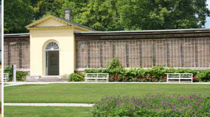
Außenansicht des Geranienhauses