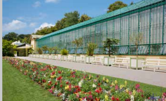
Eisernes Haus mit Blumenrabatten