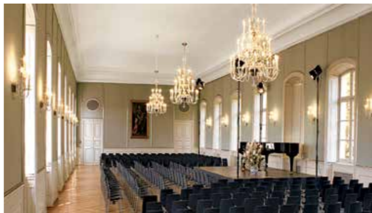
Konzertbestuhlung im Hubertussaal (oben); Orangeriesaal (unten) mit Bestuhlung und in leerem Zustand

Die ehemalige Orangerie im Erdgeschoss kann einzeln oder in Verbindung mit dem darüber liegenden Hubertussaal angemietet werden. Der Orangeriesaal ist durch seine Verbindung mit dem Foyer der ideale Ort für Stehempfänge. Mit seiner schlichten Architektur eignet er sich aber auch gut für Präsentationen oder Vorträge.