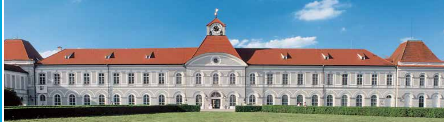
Orangerietrakt von Schloss Nymphenburg; im Inneren befinden sich der Hubertussaal, der Orangeriesaal und der Johannissaal

Bayerischer Staatsminister der Finanzen und für Heimat