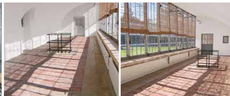
Innenraum des Geranienhauses